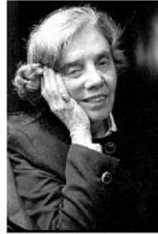
VISITA. Elena Poniatowska.

–Yo espero que el gobierno reconozca sus derechos, que los ayude, que cumpla sus pactos. En definitiva, que ganen los zapatistas. □