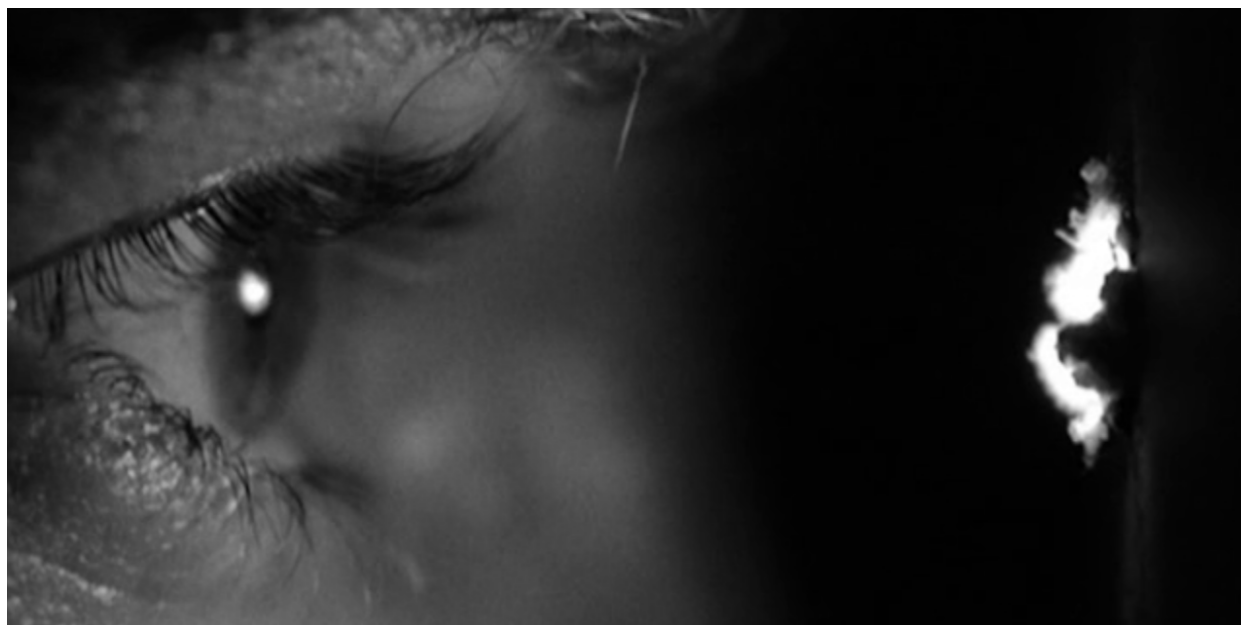
Norman (Anthony Perkins) espía a su inquilina Marion (Janet Leigh) © Fotograma del film Psycho (Psicosis, 1960) de A. Hitchcock

“Me había puesto a mirar con unos ojos nuevos e iba de sorpresa en sorpresa. Es extraño y estimulante descubrir bruscamente a los cuarenta años un aspecto del mundo que salta a la vista y que una no veía [Simone de Beauvoir en La fuerza de las cosas (1963)]