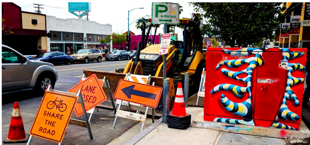
Superamos los obstáculos