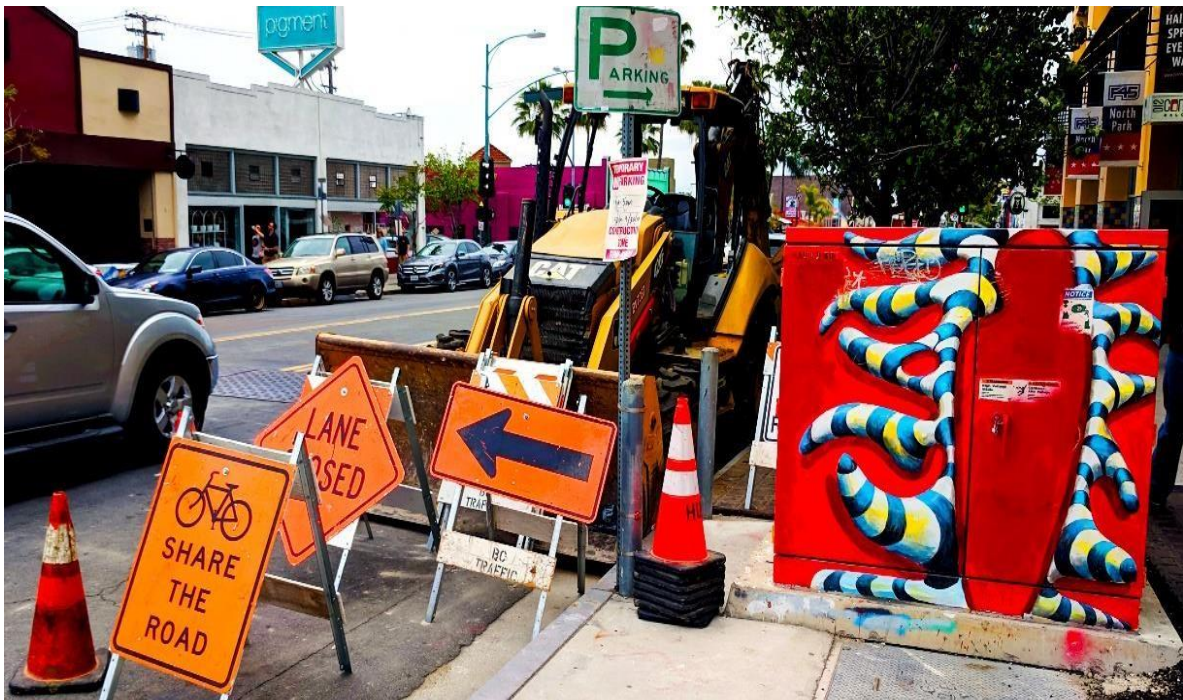
Superamos los obstáculos