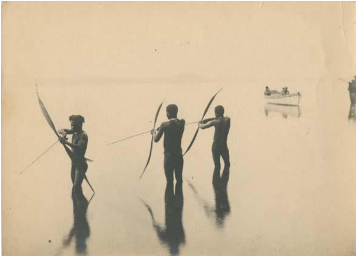
Nativos practicando la caza, imagen tomada por Bronislaw Malinowski en las islas Trobriand (1918).

Las imágenes pueblan nuestras sociedades, ¿cómo podemos aproximarnos a su comprensión y estudio?, ¿qué hace una imagen además de representar el mundo?, ¿qué métodos son necesarios para abordar el estudio de la visualidad? Esta asignatura se aproxima al estudio de la visualidad desde una doble perspectiva, se interesa por los sistemas visuales como objeto de investigación y por los métodos de investigación visuales. La asignatura plantea una reflexión sobre las imágenes y los métodos necesarios para comprenderlas y se interesa por la presencia de lo visual en las distintas instancias de la práctica antropológica, de manera específica: lo visual como objeto de investigación, lo visual como forma de representación y lo visual como modo de indagación.