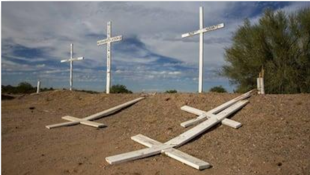
Foto: Cruces en recuerdo de migrantes muertos que intentaron llegar a Estados Unidos situado en una carretera en el estado de Sonora, en México.

Tutorías: lunes, martes y miércoles de 11:00 a 13:00. Reserva de cita previa: https://calendar.app.google/ScJB2VnKBWz6rxem6