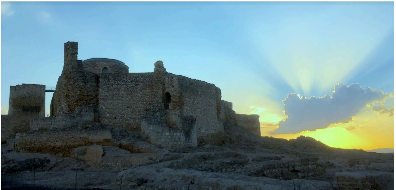
CALATRAVA LA VIEJA. La ciudad andalusí de La Mancha

Más información: Agenda Académica y Cultural de la Facultad de Filología