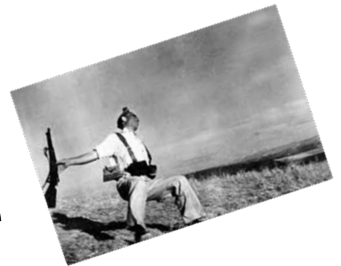
LA GUERRA CIVIL ESPAÑOLA

http://elblogdemruiz.blogspot.com.es/2013/04/la-guerra-civil-espanola_19.html