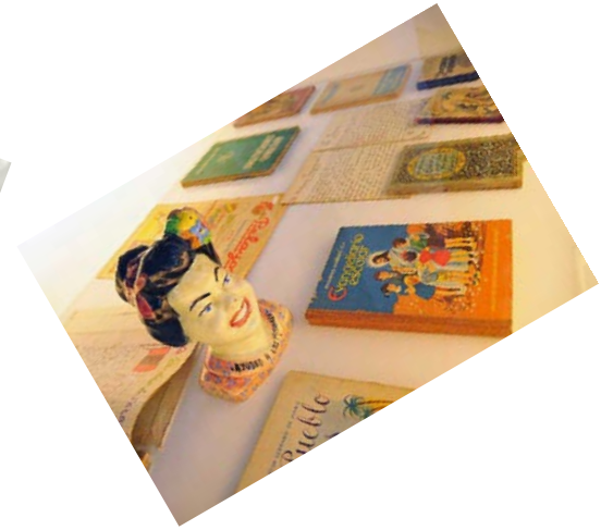
Una mirada retrospectiva desde el museo escuela