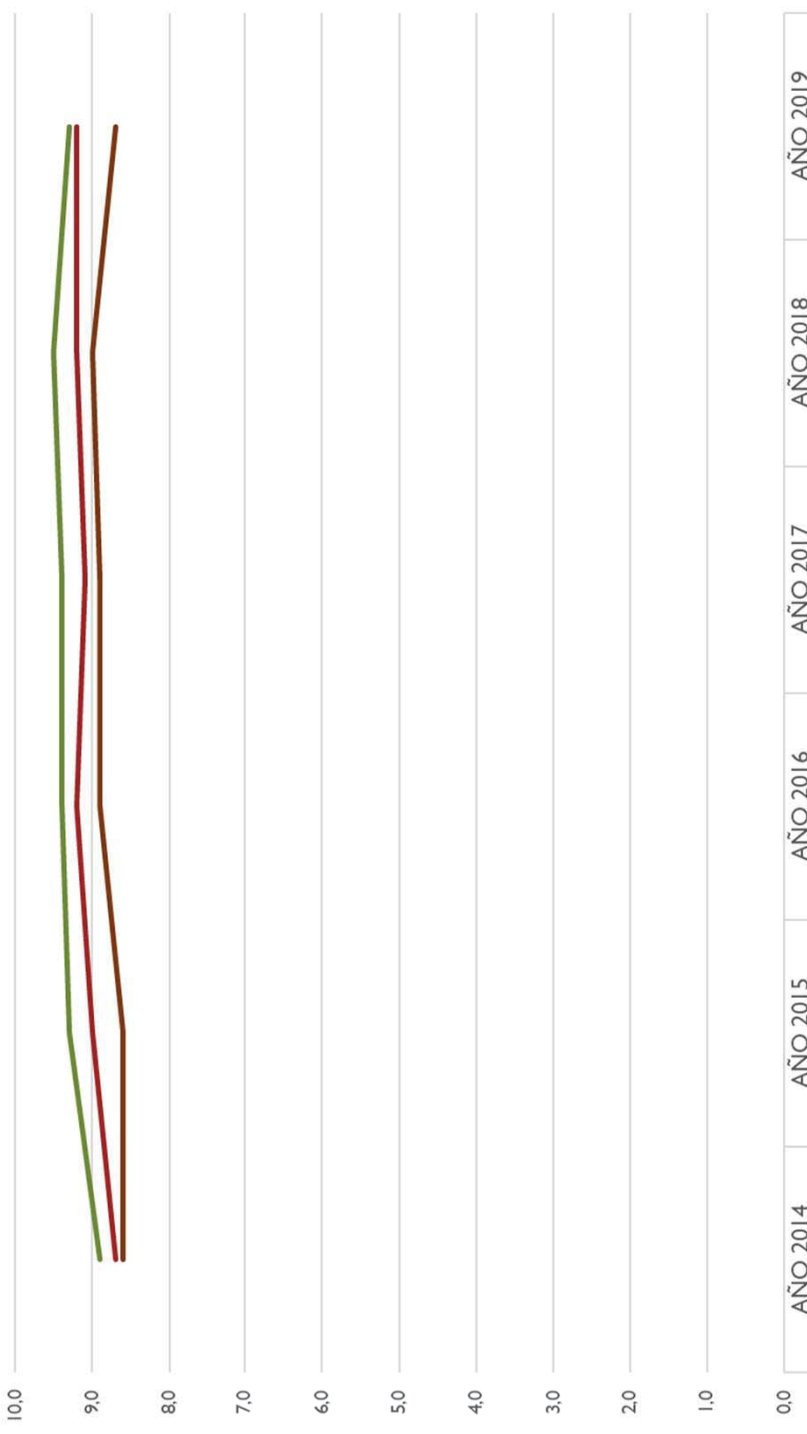
BIBLIOTECA COMPLUTENSE. EVOLUCIÓN DEL RESULTADO DE LAS ENCUESTAS DE EVALUACIÓN A LOS DOCENTES

Valoración de 0 (Muy insatisfecho) a 10 (Muy satisfecho)