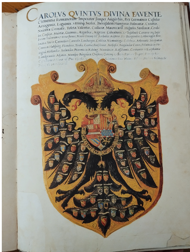
Fol. 177r: CAROLUS QUINTUS DIVINA FAVENTE

La edición facsímil en posesión de la Biblioteca de Geografía e Historia reproduce el primero de los tres tomos de la obra y está acompañado por un estupendo estudio de Elisabeth Scheicher.