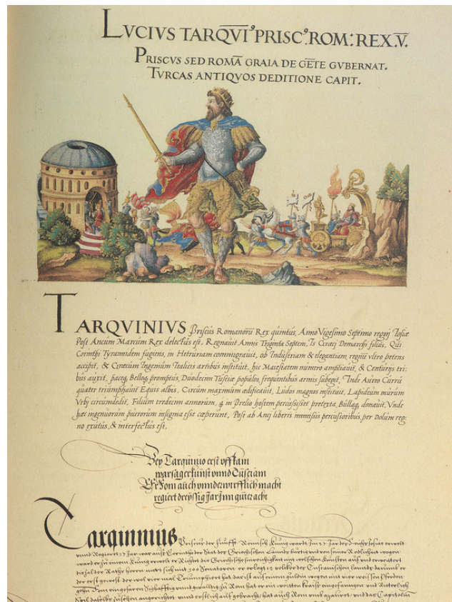
Fol. 43r: LUCIUS TARQUI(nus) PRISC(us) ROM(anorum) REX V.

Se puede acceder al texto completo de los tomos primero y tercero a través del recurso RBME Digital: