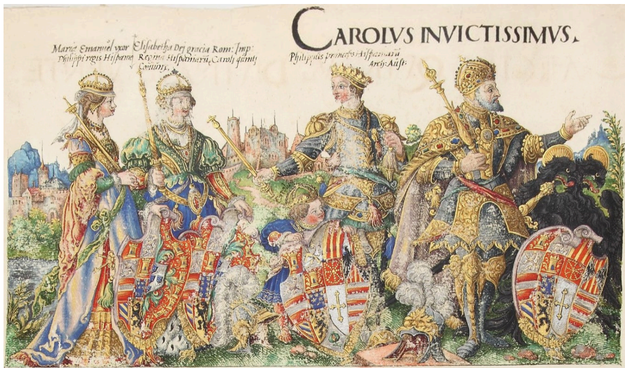
Fol. 176v: CAROLVS INVICTISSIMVS

En este sentido, el contenido de este lujoso obsequio se nos muestra perfectamente coherente con la circunstancia histórica en que se entregó, que no era otra que ese Felicissimo Viaje (1548-1551) que estaba llevando al príncipe Felipe por Alemania y Países Bajos con el objetivo de presentarle ante Europa como el sucesor de Carlos V.