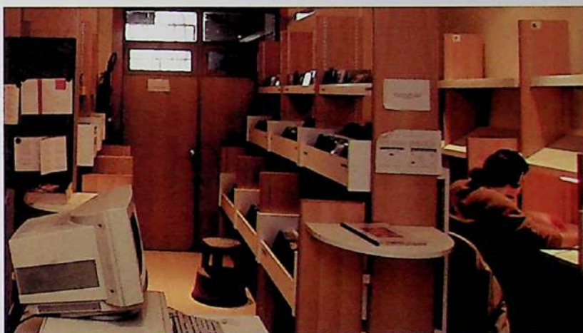
Figs. 74. Mediateca de la Facultad de Geografía e Historia.

básicas del Instituto Geográfico Nacional, Instituto Tecnológico Geominero, Servicios Geográfico del Ejército y Ministerio de Agricultura entre otros. Tiene también las series de Ortoimágenes de España editadas por el Instituto Geográfico Nacional y gran número de fotografías aéreas, así como más de 140 mapas murales entelados, el plano parcelario de Madrid de finales del siglo xx publicado por el Instituto Geográfico y Estadístico y un ejemplar del plano de Madrid y pueblos colindantes anteriores al siglo xx de Facundo Cañadas López.