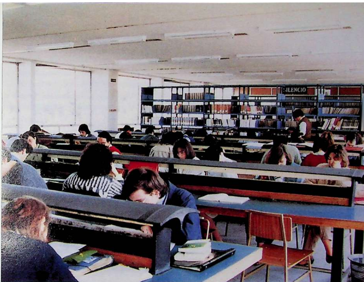
Fig. 69. Antigua Biblioteca de la Facultad de Geografía e Historia.

tidos a partes iguales entre la tercera y cuarta planta. La tercera planta estaba dedicada a depósito de libros, con una ocupación lineal de estanterías de 2.760 metros: 922 utilizados con libros de la biblioteca y el resto sin utilizar o bien ocupados con libros y tesis de cátedras no pertenecientes a la Facultad de Geografía e Historia, principalmente de Filología, que se habían visto afectadas también por el traslado forzoso. La 4.ª planta comprendía la sala de lectura –con 480 m 2 y una capacidad de 230 puestos de lectura–, servicio de préstamo y dependencias administrativas. A estos espacios había que añadir la Sala de Arte y el Depósito de Revistas en la planta primera. La superficie de locales se mantendrá inalterable hasta la construcción del nuevo edificio de la Biblioteca de Humanidades en el antiguo Paraninfo del edificio B. El total de libros era de 20.800, de los que sólo 14.700 estaban catalogados y clasificados por la CDU. Tras la incorporación de los fondos departamentales se había procedido a la sustitución del sistema de clasificación Cutter por el de CDU. No catalogados había 6.330 libros. (Fig. 69)