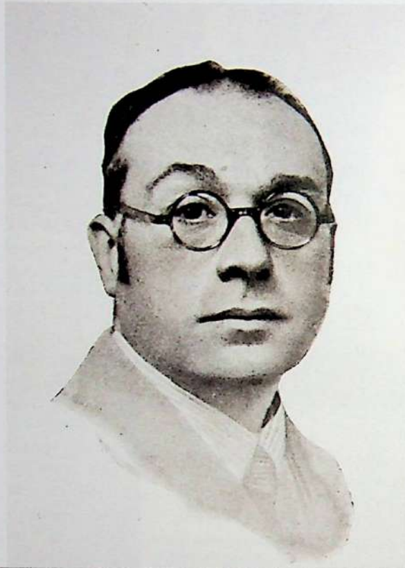
Fig. 75. Manuel García Morente.

finalidad es ser un servicio de apoyo al estudio, investigación y docencia en la licenciatura de Historia y Ciencias de la Música, así como dar servicio a todos los miembros de la comunidad complutense, facilitando el acceso a los documentos sonoros, especialmente CD's, que pueden utilizarse junto al resto del material musical (partituras, libretos, etc.) de la biblioteca. Actualmente cuenta con seis cabinas de audio. Presta servicios de audición de CD's y cassetes, así como de préstamo de estos materiales.