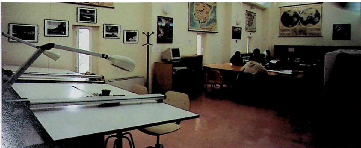
Figs. 73. Cartoteca de la Facultad de Geografía e Historia.