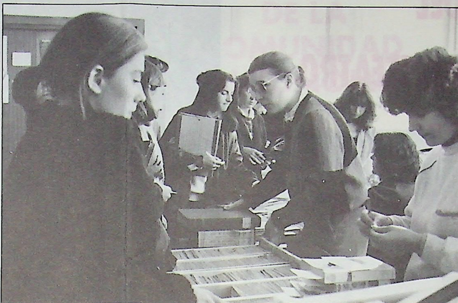
La Biblioteca de esta Facultad tiene uno de los índices de préstamos más altos de toda la Universidad.

El cuestionario se organizó de la forma si-